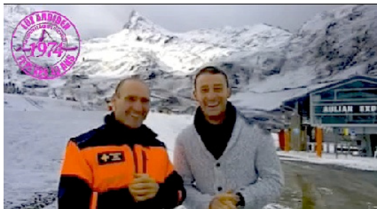
La station de ski de Luz Ardiden

La saison 2014-2015 est une saison anniversaire pour notre station. Tout était fin prêt pour accueillir les skieurs à Béderet en décembre 1974, mais nous sommes nombreux à nous souvenir des vrais débuts, en janvier 1975, sur des pentes où la paille venait compléter le manque de neige. Il y avait une ambiance toute particulière à la station, comme un « esprit de résistant » qui régnait, le petit David arrivait pour se frotter aux grandes stations déjà établies.